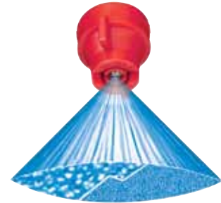
À pression de 1 bar (15 PSI) À pression de 4 bar (60 PSI)